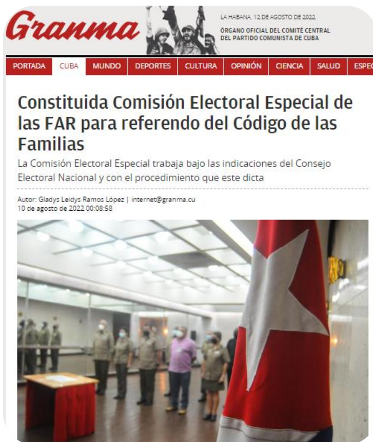
Ilustración 2 Extraída de la web de Granma el 10/8/22 https://www.granma.cu/cuba/2022-08-10/constituida-comision-electoral-especial-de-las-far-para-referendo-del-codigo-de-las-familias-10-08-2022-00-08-58

De acuerdo al artículo 54 de la Ley Electoral las Comisiones Electorales Especiales son constituidas a propuesta de los consejos electorales municipales. Estas ejercen sus funciones en demarcaciones específicas, tienen su sede en los locales habilitados al efecto y pueden constituirse en cualquier momento del desarrollo del proceso. Están integradas por un presidente, un secretario y hasta ocho (8) vocales. Una vez aprobadas se constituyen y sus integrantes toman posesión ante un representante del Consejo Electoral Municipal. El Consejo Electoral Nacional aprueba las comisiones electorales especiales que a su nivel correspondan, las que se constituyen y sus integrantes toman posesión ante este.